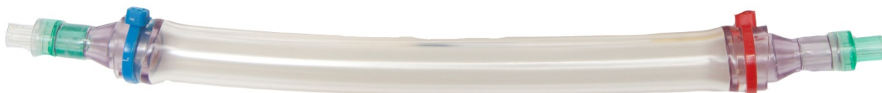
Рис. 2. Одноразовый пульсовой насос крови к аппаратам серии «Гемос» для плазмафереза и гемосорбции (год создания – 1998).

Выполнены по технологии экструзии, прессования и формования силиконовой композиции с использованием платиновых катализаторов.